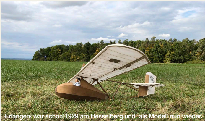
Erlangen war schon 1929 am Hesselberg und als Modell nun wieder

Die Ausstellung 100 Jahre Segelflug am Hesselberg im Haus der Geschichte in Dinkelsbühl nähert sich dem Thema auf unterschiedlichen Wegen: z. B. über Tagebuchaufzeichnungen einer englischen Flugschülerin, die Erinnerungen des ersten Fluglehrers und Schulgründers, zahlreiche Schriftstücke aus Archiven, privaten Nachlässen und Sammlungen. Ein Modell des Hesselbergs zeigt das Fluggelände. Modelle historischer Flugzeuge und zahlreiche Fotos fehlen natürlich auch nicht. Nur wenige der ausgestellten Stücke wurden bisher öffentlich gezeigt.