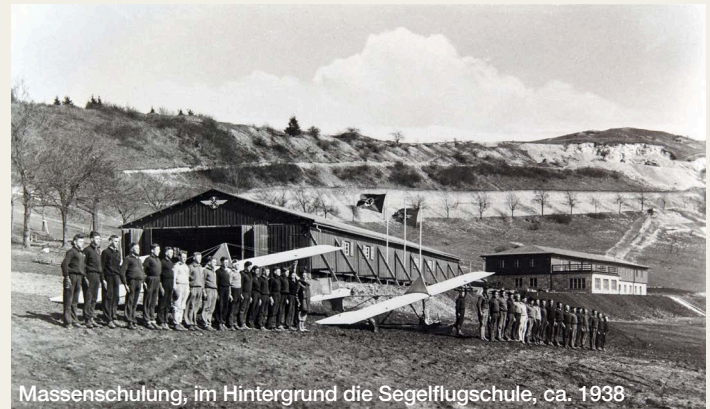
Massenschulung, im Hintergrund die Segelflugschule, ca. 1938

Spätestens ab 1937 reduzierte sich der Schulbetrieb am Hesselberg auf die segelfliegerische Grundausbildung. Die Schulung auf preiswerten Schulgleitern war eine einfache Möglichkeit, die Kandidaten auszuwählen, die für die weitere Pilotenausbildung in Frage kamen.