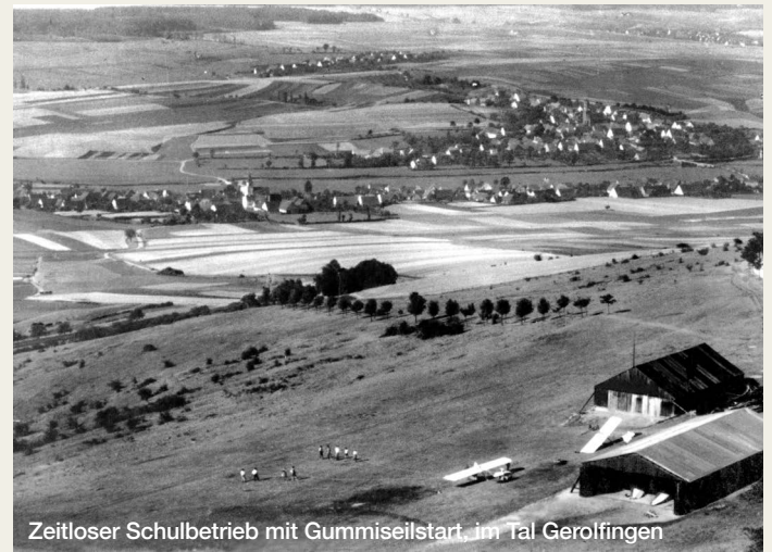
Zeitloser Schulbetrieb mit Gummiseilstart, im Tal Gerolfingen

Die Ausstellung erstreckt sich zeitlich von 1926 bis zum Ende der NS-Zeit 1945. Bis 1933 wurde das Segelfliegen von Vereinen organisiert.