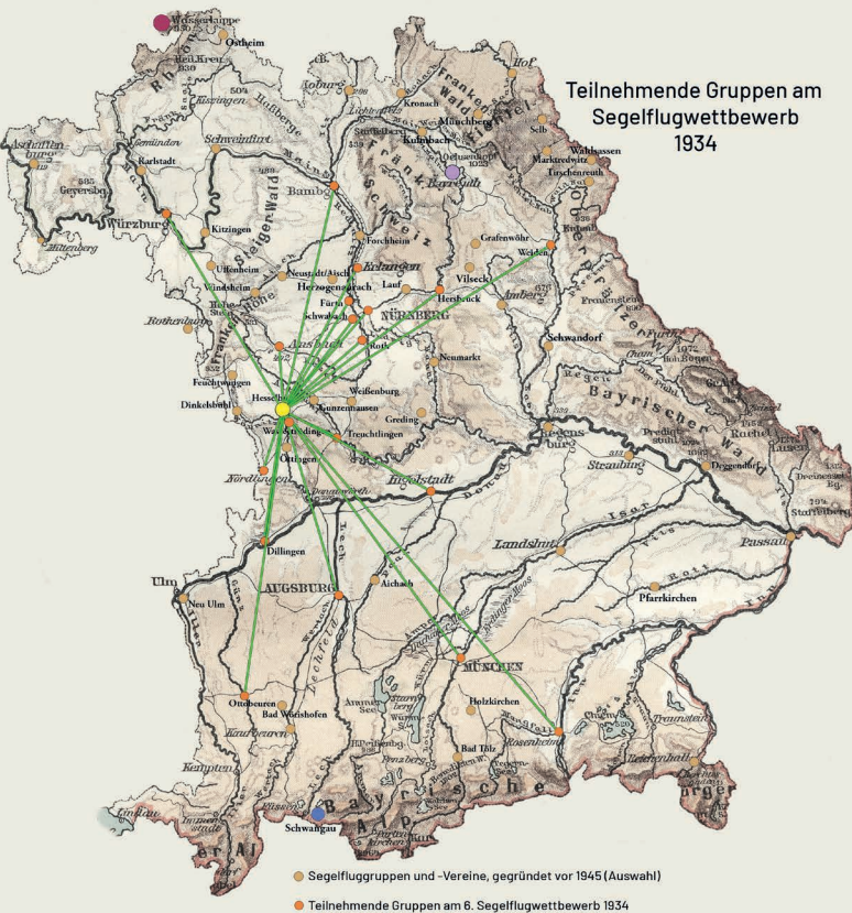
Teilnehmende Gruppen am Segelflugwettbewerb 1934