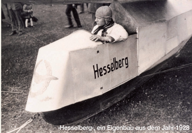
Hesselberg, ein Eigenbau aus dem Jahr 1928

Die Ausstellung 100 Jahre Segelflug am Hesselberg im Haus der Geschichte in Dinkelsbühl nähert sich dem Thema auf unterschiedlichen Wegen: z. B. über Tagebuchaufzeichnungen einer englischen Flugschülerin, die Erinnerungen des ersten Fluglehrers und Schulgründers, zahlreiche Schriftstücke aus Archiven, privaten Nachlässen und Sammlungen. Ein Modell des Hesselbergs zeigt das Fluggelände. Modelle historischer Flugzeuge und zahlreiche Fotos fehlen natürlich auch nicht. Nur wenige der ausgestellten Stücke wurden bisher öffentlich gezeigt.